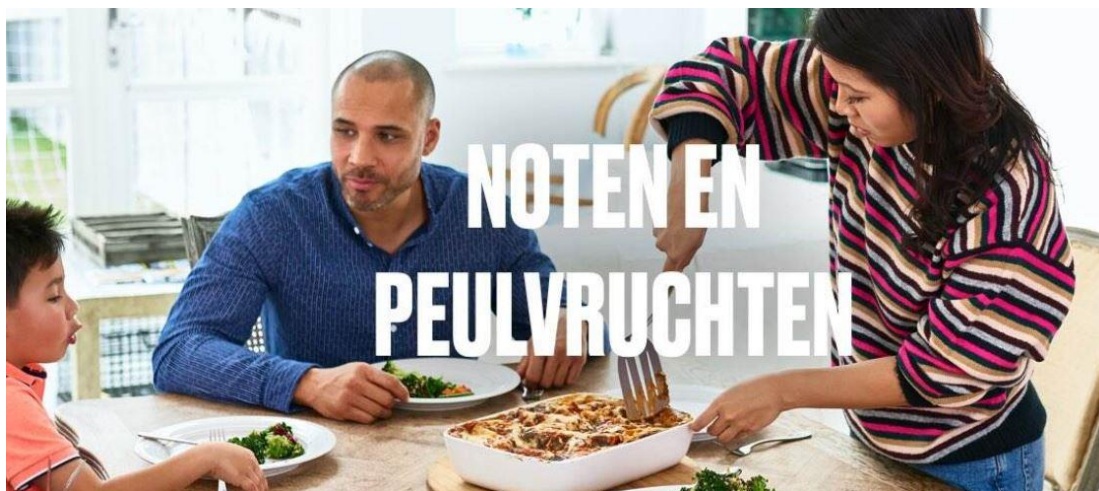
Figuur 3. Op de huidige campagnepagina praat de overheid over ‘meer noten en peulvruchten’, om zo niet te hoeven praten over ‘minder vlees’.